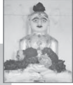
શ્રી શાંતિનાથ ભગવાન