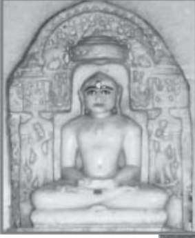
શ્રી અજિતનાથ ભગવાન

સામાન્ય કેવળીઓમાં ઉત્તમ / પ્રધાન એવા અજ્ઞાન રહિત સ્વભાવને ધારણ કરનારા, સરળતા, નિરાભિમાનીપણું, ક્ષમા, નિર્લોભતા અને સમાધિના ભંડારરૂપ શાંતિને કરનારા, ઈન્દ્રિયોનું દમન કરવામાં ઉત્તમ, તીર્થને પ્રવર્તાવનારા, શાંતિનાથ ભગવાનને હું પ્રણામ કરું છું. તે શાંતિ મુનિ / ભગવાન મને શાંતિ તથા સમાધિરૂપ વરદાન આપો....૮