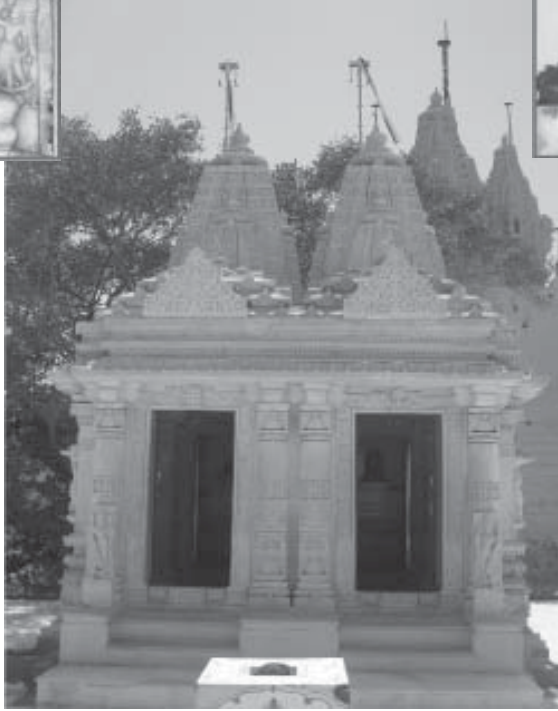
શ્રી અજિત-શાંતિની દેરી