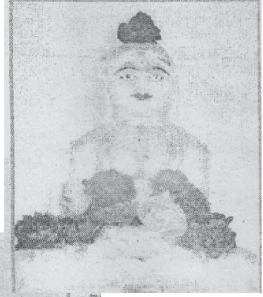
श्री शांतिनाथ भगवान