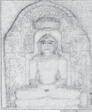
श्री अजितनाथ भगवान